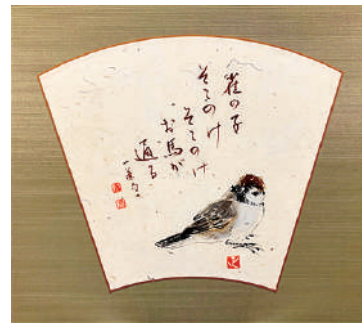
「一茶の句」 絵:黒澤 正 書:市川 嘉泉